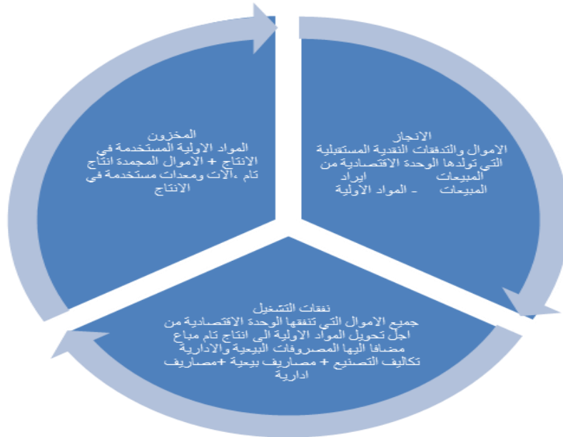
الشكل (1) من اعداد الباحثين