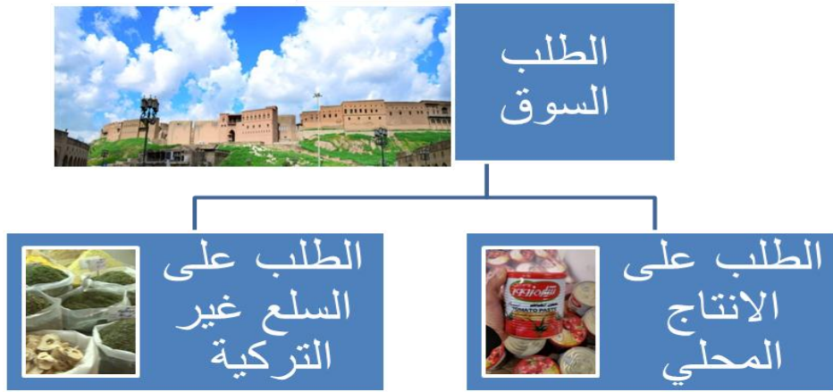
شكل رقم (2)الطلب السوق

أن المقاطعة السلع والخدمات الترقية يؤدي الى تقسيم وتحويل الطلب من السلع والخدمات الترقية الى الطلب على السلع والخدمات المحلية من جهة والطلب على السلع والخدمات الجنبية من جهة الأخرى ، كما هو موضح في الشكل رقم (2):