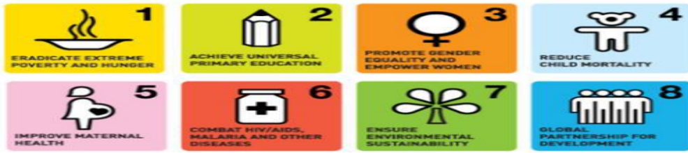
الشكل (1) الأهداف الإنمائية الثمانية للألفية

بينما تضمنت الأهداف الإنمائية للألفية (8) أهداف و(21) غاية، فإن أهداف التنمية المستدامة لديها (17) هدفاً و(169) غاية [61]، الأهداف الإنمائية للألفية هي كما في الشكل (1)، هذه المجموعة من الأهداف هي (1) القضاء على الفقر المدقع والجوع، (2) تعميم التعليم الابتدائي، (3) تعزيز المساواة بين الجنسين وتمكين المرأة، (4) الحد من وفيات الأطفال، (5) تحسين صحة الأم، (6) مكافحة فيروس نقص المناعة البشرية/الإيدز والملاريا والأمراض الأخرى، (7) ضمان الاستدامة البيئية، (8) تطوير شراكة عالمية من أجل التنمية [62].