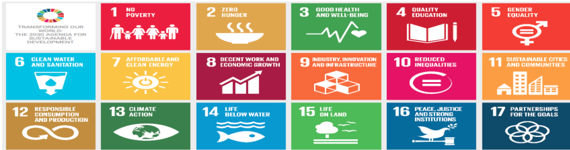
الشكل (2) أهداف التنمية المستدامة السبعة عشر

من أجل تحقيق أهداف التنمية المستدامة، تحتاج البلدان الأفقر إلى إحراز تقدم كبير في جميع الأهداف مع التركيز على إنهاء الفقر المدقع، وضمان الوصول إلى الخدمات الأساسية والبنية التحتية، والحد من التدهور البيئي، وتعزيز الإدماج الاجتماعي [63]، دخلت الدول الأعضاء في الأمم المتحدة البالغ عددها (193) دولة، جنباً إلى جنب مع عدد كبير من المجتمع المدني والأكاديميين وأصحاب المصلحة من القطاع الخاص، أسفرت عن إعلان خطة التنمية المستدامة لعام (2030) التنمية المستدامة، مع أهداف التنمية المستدامة [64]، التعريف الأكثر اقتباساً للتنمية المستدامة "التنمية المستدامة هي التنمية التي تلبي احتياجات الحاضر دون المساس بقدرة الأجيال القادمة على تلبية احتياجاتهم الخاصة" [65]، تمت المصادقة على التعريف بعد خمس سنوات في مؤتمر (Rio)، "قمة الأرض" في عام (1992) [66]، في عام (2015) كنتيجة للأهداف الإنمائية للألفية، تم تحديد أهداف التنمية المستدامة [52]، كما في الشكل (2) التي تتكون من (17) هدف [67].